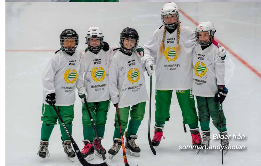
Bilder från sommarbandyskolan