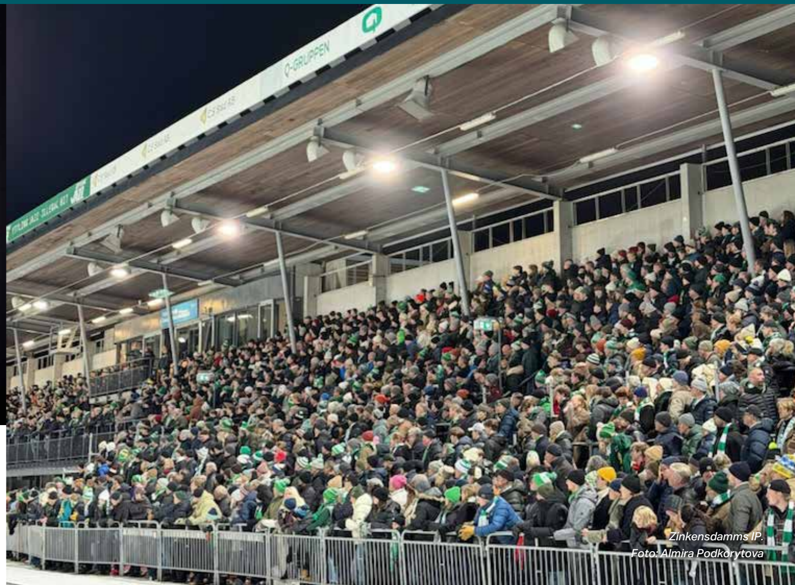
Zinkensdamms IP.

– Inför kommande säsong är ett av mina mål att vara mer närvarande ute hos våra elitserieföreningar och få möjlighet att lära känna dem ännu bättre!